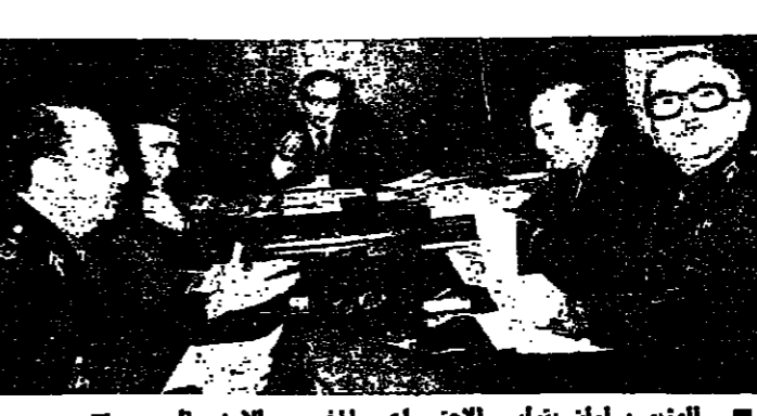
الوزير سلمان يترأس الاجتماع الخاص للامن والسياسة

كرم وزير الداخلية الدكتور صلاح سلمان الاجتماعات التي عقدها امس في مكتبه لمعالجة قضايا الامن والاسكان . فقد عقد الوزير سلمان اجتماعا اميا في الساعة التاسعة صباحا حضره مدير عام قوى الامن الداخلي السيد هشام الشعار وبعض معاونيه والمستشار العسكري لوزير الداخلية المقدم الركن محمود ابو عزم ، ثم فيه عرض ما حققته رجال الامن الداخلي من انتصارات حتى الان على صعيد تثبيت الامن وتطبيق السر في البلاد .